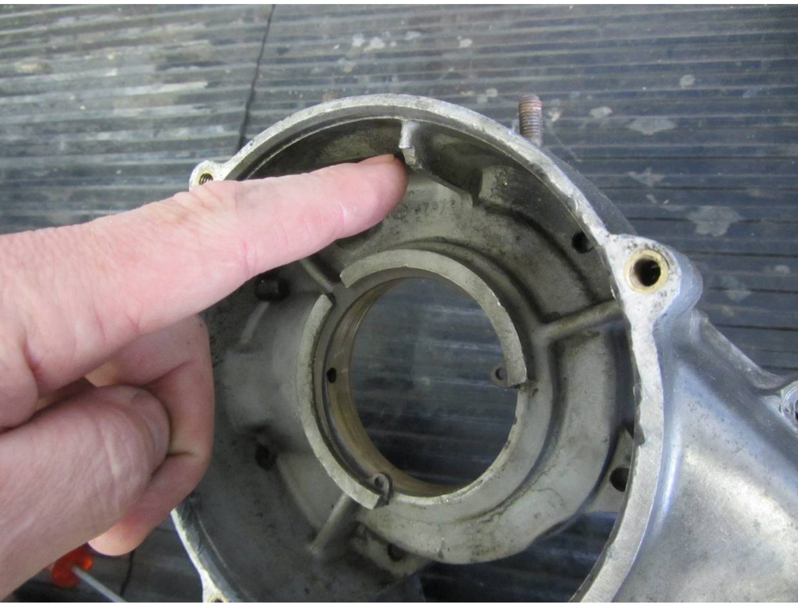
150ccm Motorgehäuse vor der Bearbeitung

Motorgehäuse mit 80-150ccm vor Bj. 1998 weisen im Aluminiumguß eine Abtropfkante für das Getriebeöl auf. Für die Montage einer größeren Kupplung wie der bgm PRO Superstrong, muß diese Nase etwas zurückgenommen werden.